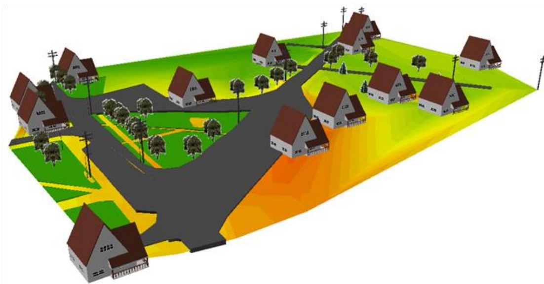
3.12 pav. Topografinio plano skaitmeninis 3D modelis